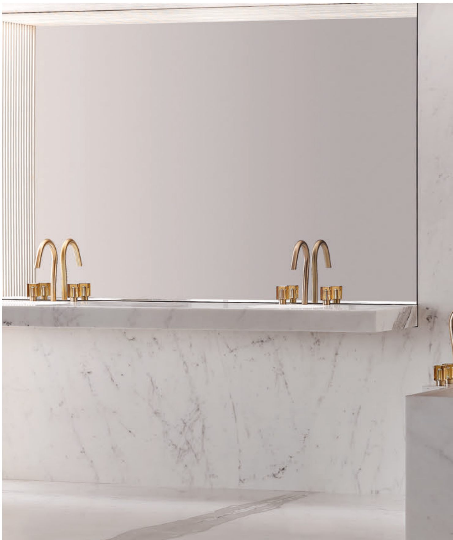
COLLECTION BEYOND CRYSTAL