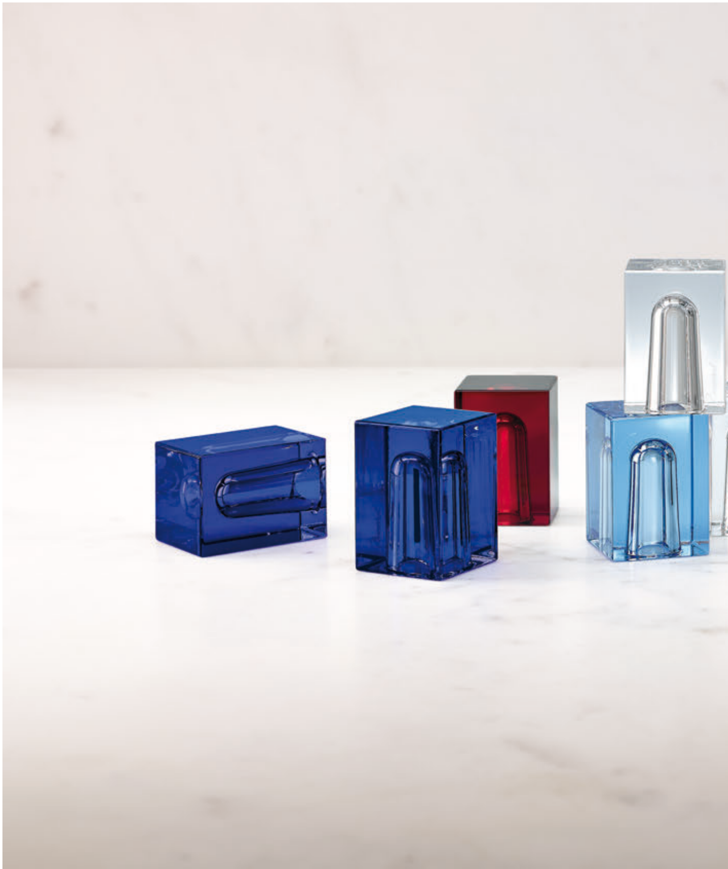
COLLECTION BEYOND CRYSTAL