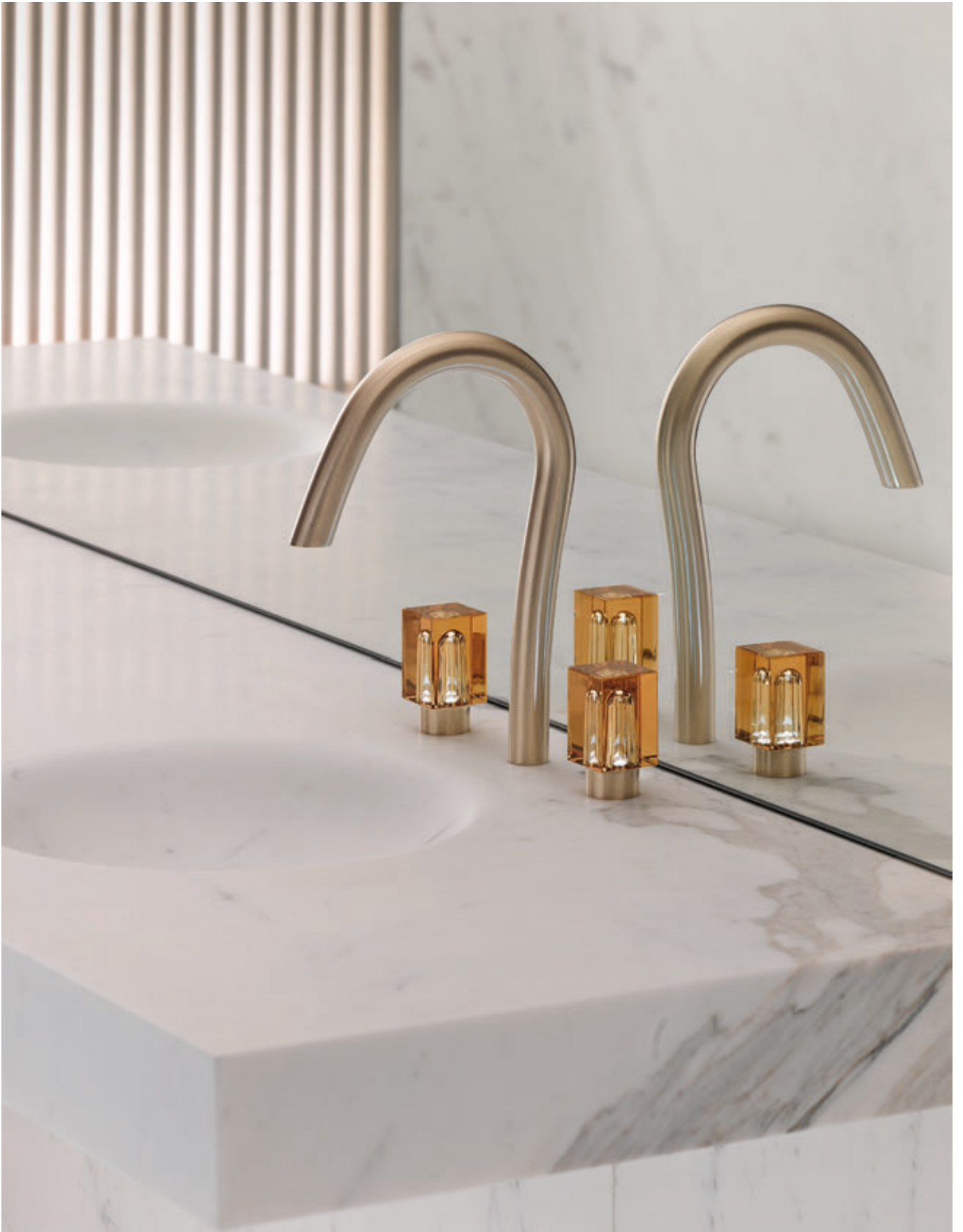
LAVABO - BASIN - WASCHTISCH