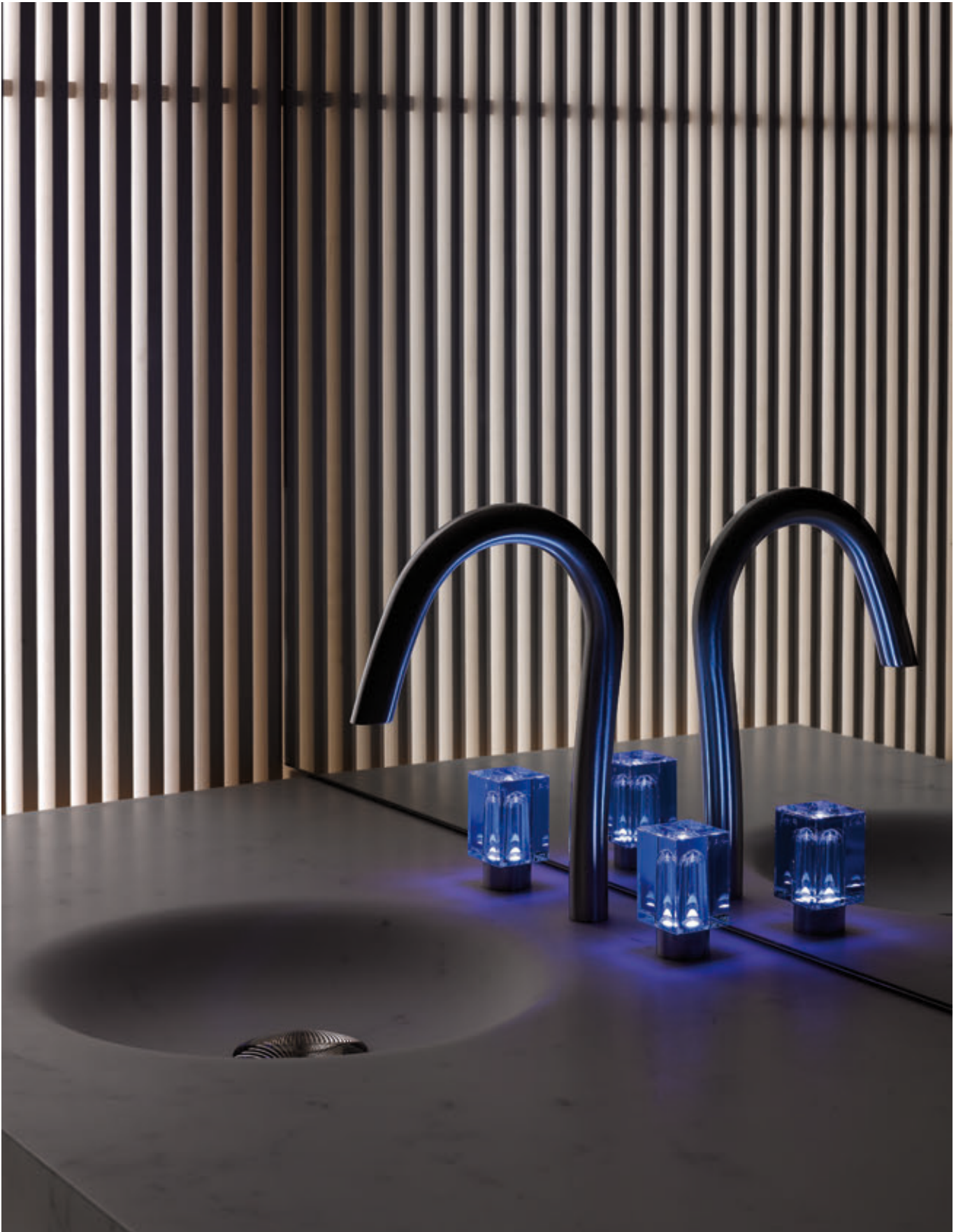
COLLECTION BEYOND CRYSTAL