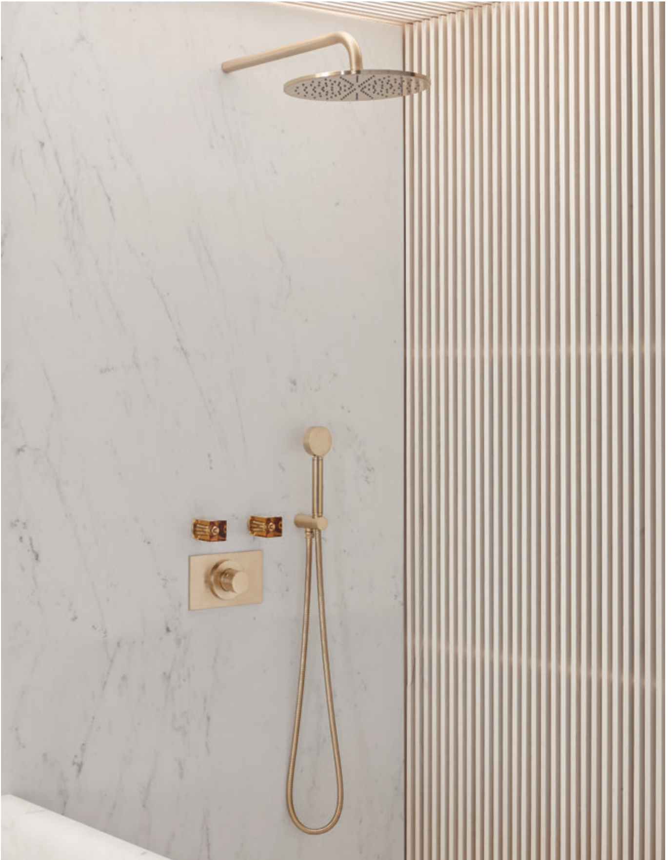
DOUCHE - SHOWER - DUSCHE