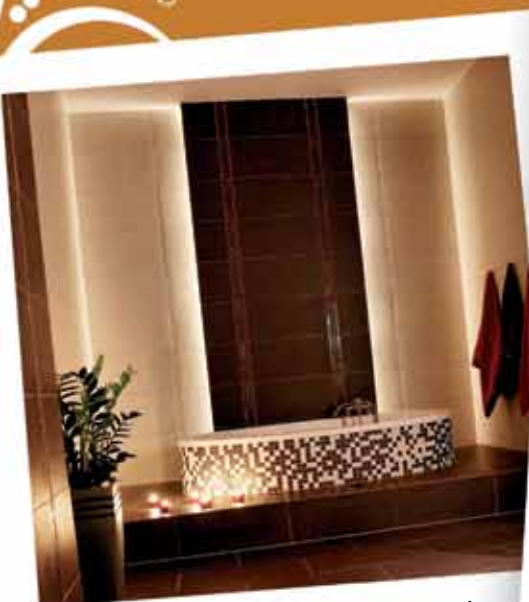
łazienka Stanisławy Budynkiewicz z Chojna

Zobacz jak pięknie można mieszkać kupując u nas płytki!