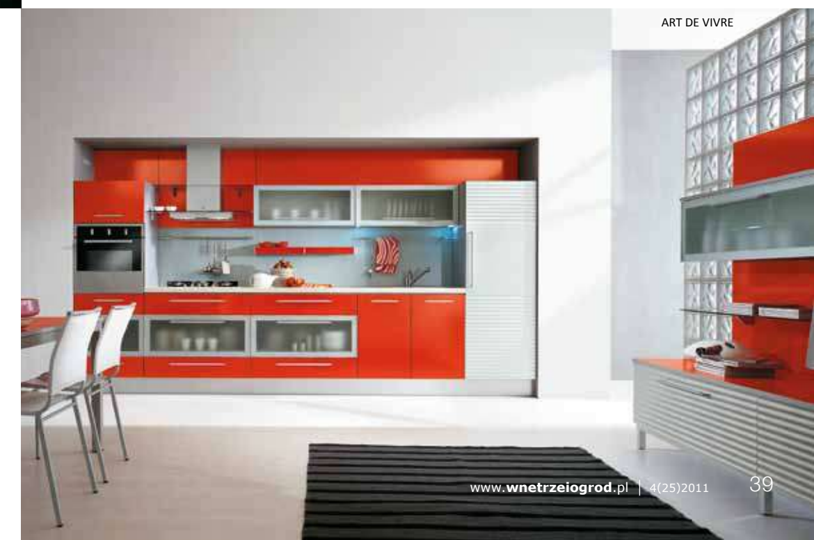
ART DE VIVRE

Podłoga najczęściej jest tłem dla kulinarnej sztuki. Powinna więc być skrupulatnie dobrana do stylistyki kuchni, zarówno pod względem kolorystycznym, jak i materiałowym. Ciemne barwy idealnie sprawdzą się w dużych kuchniach, w których jest wystarczająco miejsca na eksponowanie podłogi. Częściej jednak wybierane są jaśniejsze odcienie, które z powodzeniem optycznie powiększają przestrzeń. Ważne jest, aby unikać stosowania na kuchennych podłogach miejscowych wzorów i dekoracji. Tego typu zabiegi niepotrzebnie wprowadzą chaos do kuchni, w której przeważnie i tak dużo się dzieje.