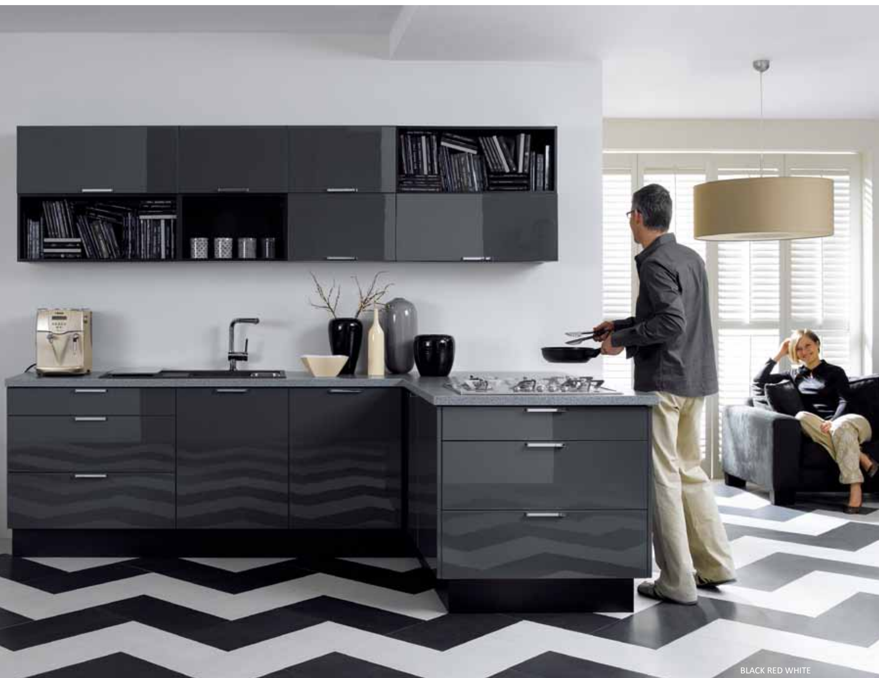
BLACK RED WHITE